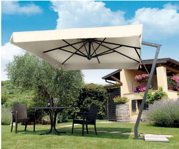
LAGO DI GARDA - ITALY