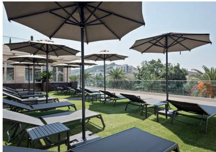
MELIA BUDVA - MONTENEGRO