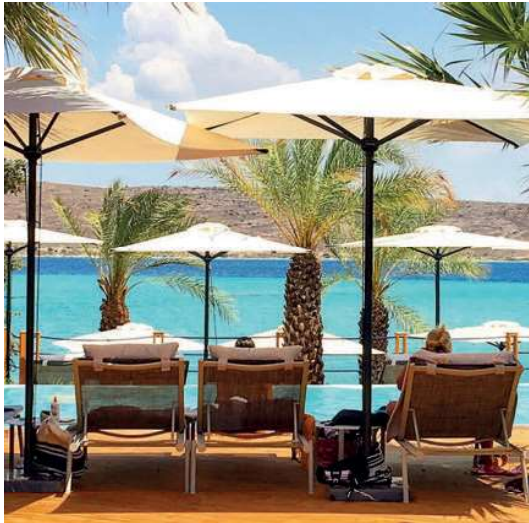
ALACATI RESORT HOTEL - TURKEY